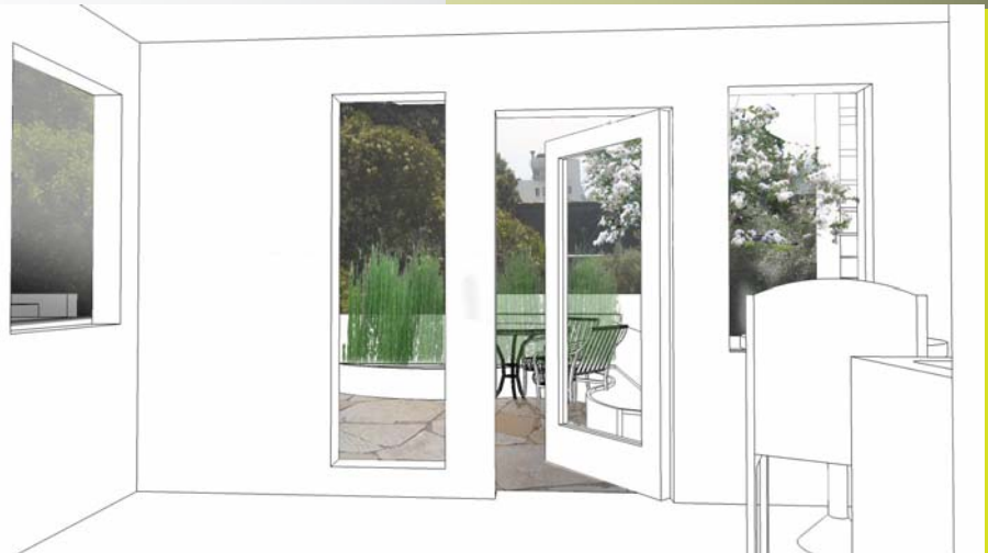
花園景觀的一室公寓